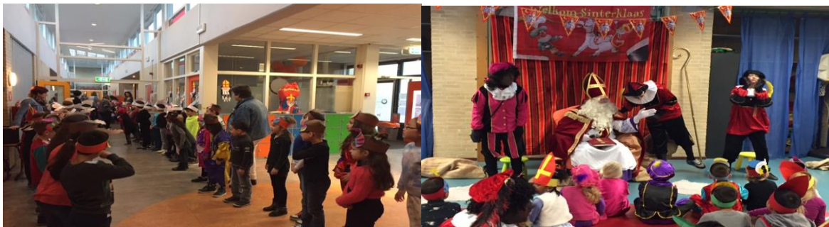
Vol verwachting klopt ons hart.....

Op vrijdag 02 december 2016 heeft Sinterklaas, samen met vier pieten, een bezoek gebracht aan onze school. De leerlingen van de groepen 1 t/m 4 mochten bij hem op bezoek. Samen werden er liedjes gezongen en daarnaast werden de kinderen door Sinterklaas getraakteerd. In de groepen 5 t/m 8 werd er Sinterklaasbingo gespeeld. Twee pieten kwamen ook nog even bij hen op bezoek. Wij kijken terug op een geslaagde Sinterklaasviering en bedanken de Oudervereniging voor de organisatie. Hieronder een aantal foto's.